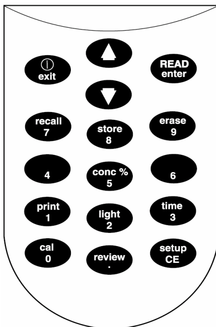
表 1 按键及功能